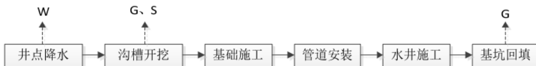
图 8.1-5 管线工程施工基本工艺流程图

项目不设建筑材料拌和场，施工所需碎石、混凝土等建筑材料均使用商业拌和厂拌和好的建筑材料。不在现场熬炼沥青，路面沥青铺设过程全部使用商业沥青，沥青在专业站场进行熬制、拌和。由密闭装载车将已熬制或拌和好的物料运至铺筑工地直接进行摊铺。