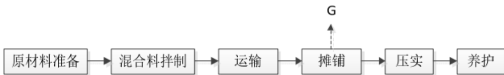
图 8.1-3 路面沥青摊铺施工基本工艺流程图

项目不设建筑材料拌和场，施工所需碎石、混凝土等建筑材料均使用商业拌和厂拌和好的建筑材料。不在现场熬炼沥青，路面沥青铺设过程全部使用商业沥青，沥青在专业站场进行熬制、拌和。由密闭装载车将已熬制或拌和好的物料运至铺筑工地直接进行摊铺。