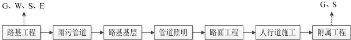
图 8.1-1 道路施工基本工艺流程图

本工程为改建工程。属于市政道路、桥梁项目。道路施工主要包块路基处理、桥头路基处理、路基防护、路面施工、路拱及路面排水等。