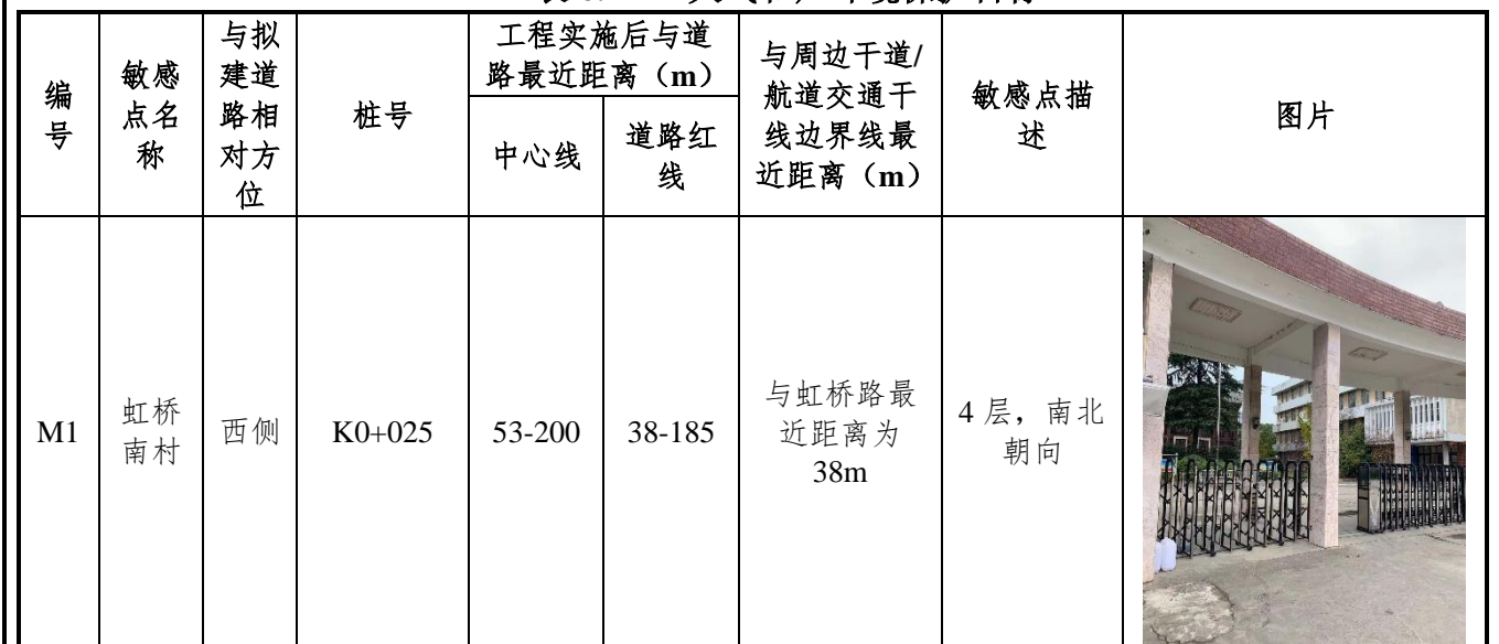
表 6.2-1 大气和声环境保护目标

本项目沿线均已拆迁，现状没有居民区。根据《南通市滨江南区（洪江路以北）控制性详细规划》和《南通市城市总体规划》（2011-2020 年），本项目沿线规划敏感目标包括：二类住宅用地。各规划用地与道路红线之间规划建设有 20m 宽绿化用地，建筑高度为 40-80m。沿线主要大气和声环境规划保护目标见表 6.2-1。