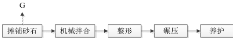
图 8.1-2 路面基层施工基本工艺流程图